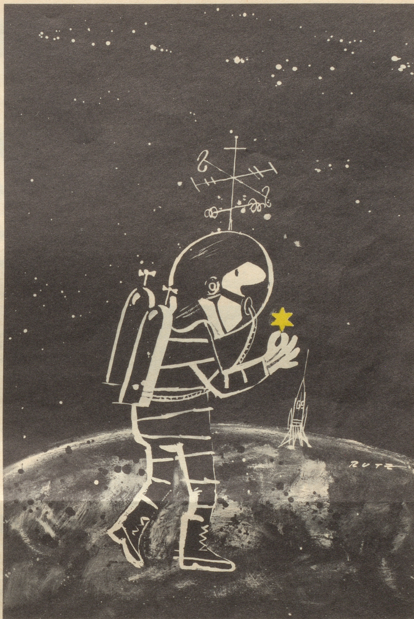
Weltraumfahrer bringt Souvenir nach Hause