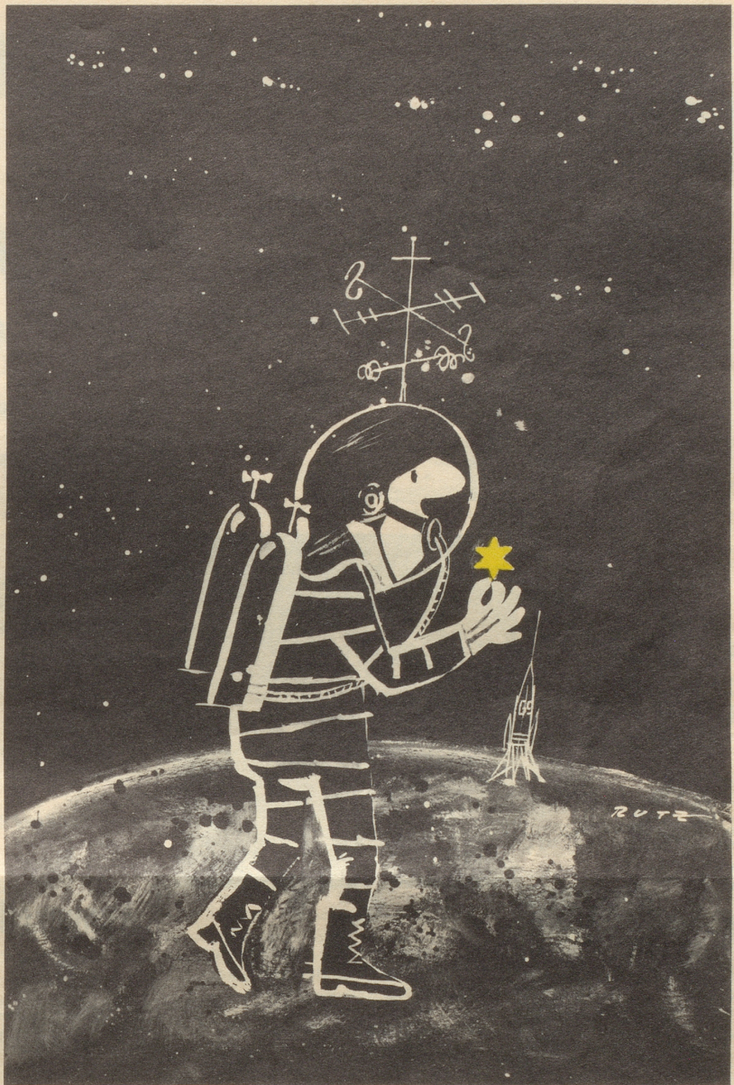
Weltraumfahrer bringt Souvenir nach Hause

«Du, Karl, wänn wämmer dänn hüürate?» «Muesch na e chli warte, Liebs: Sobald dLäbeschoschte abegönd ...» bi