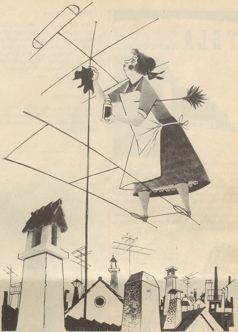
Die wackere Hausfrau

Wer weiß, aus was dieser Gummi besteht, denkt der Vorsichtige, steckt den Finger in den Mund und benetzt damit den Rand des Briefumschlages ... Boris