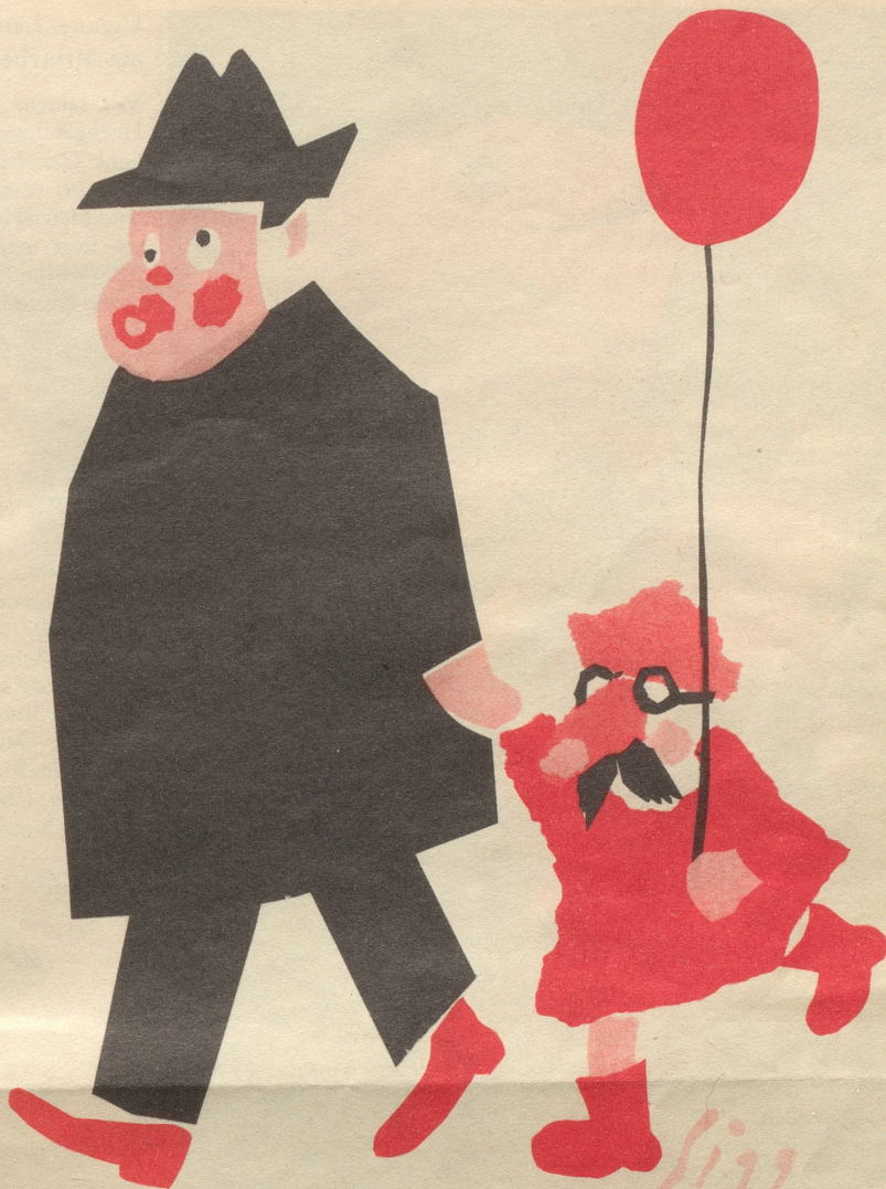
Vater und Sohn an der Fasnacht

Was mahha? Dar Khantoon sötti hälfa. Abar dä khann au nitta. Dä liidat an dar Rhätischa Bahn. Und zum dia Khrankhat awäg zbringa, bruuchts dHüülf vum aiggenössischa Tokhtar, will sääga, vum Schwizzar Volkhl!