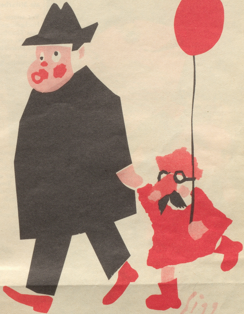
Vater und Sohn an der Fasnacht

In der ulkigen Berner Sendung «Wenn sie nur Worte haben» fiel zwischen Sprichwörtlichem und Zitätlichkeiten der nette Satz: «Stets kann man sich auf Goethe berufen wie auf einen Allerwelts-Papi ...» Ohohr