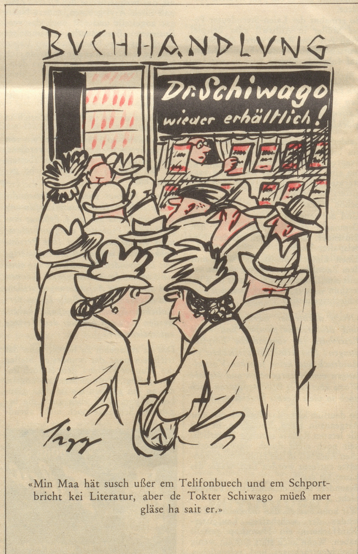
«Min Maa hät susch usser em Telefonbuech und em Schportbricht kei Literatur, aber de Tokter Schiwago müess mer gläse ha sait er.»

Ein anderes Mal rennen die beiden durch die Wüste Sahara. Von Zeit zu Zeit schaut das Mäuschen hinter sich und sagt zum Gefährten: «Uuh, lueg wie mir schtüübe!» ME