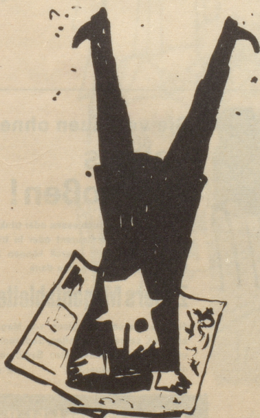
Das «Blick»-Plakat Hereingefallen!

Die Bergbevölkerung soll angesichts der Konjunktur nicht mehr Zaungast sein.