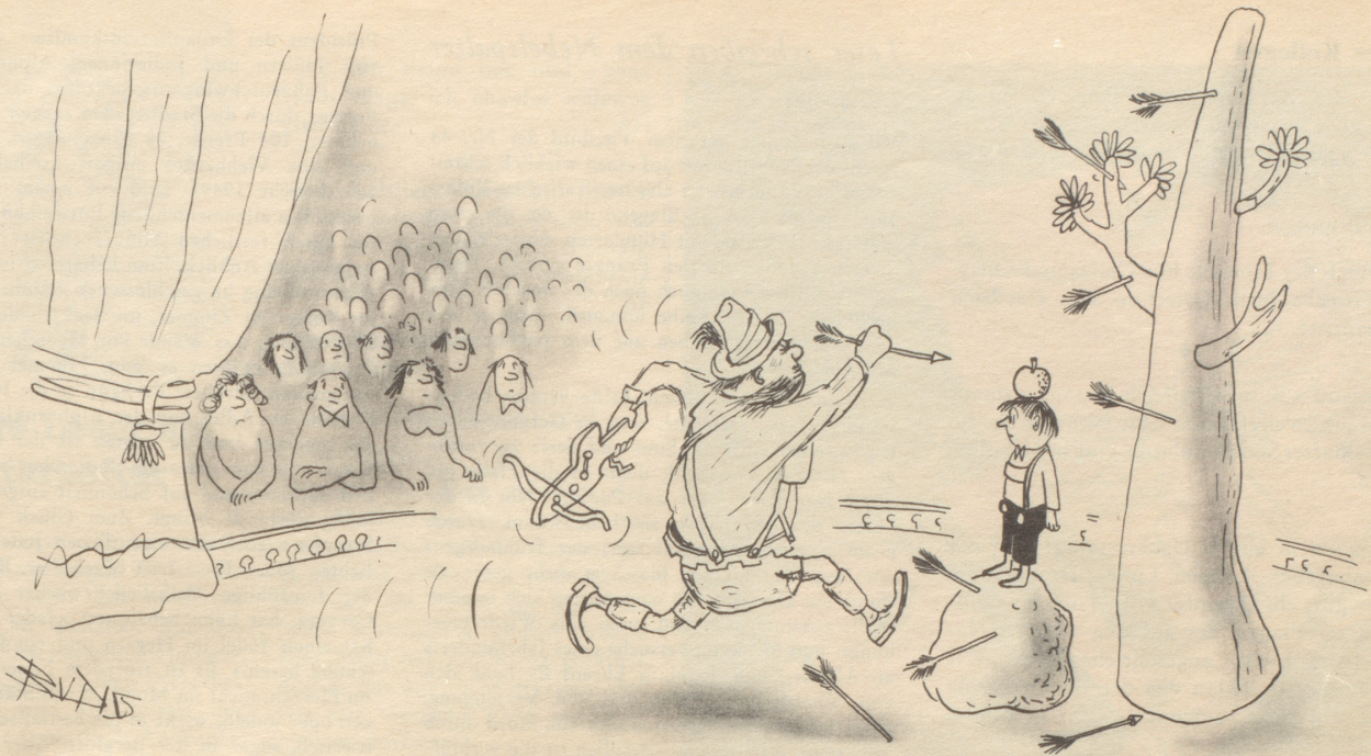
Tell im Lientheater

vor, mit einer Menge wunderbarer Geräte, die zum Gottesdienst der Männer gehören. Im Bauch des Wagens sitzt ein eingesperrter Zauberer, der Krach macht. Er zieht den Wagen schnell zur Feuerstätte, sie ziehen ihre Tanzmasken an und steigen auf eine Leiter und spritzen nasses Wasser auf Fürio, den Feuergeist. Wenn sie wieder hinunterkommen, sind sie sehr stolz, sie verschmieren sich das Gesicht mit Ruß, damit man sieht, was sie angestellt und vollbracht haben. Manchmal läuten während des Feuers alle Tempelglocken und eine Posaune auf einem Hausdach macht häßliche Musik. Wenn das Wasser über den Fürio gesiegt hat, dann versammeln sich alle und sind froh, daß sie das Haus im Wasser ertränkt haben. Sie gehen dann in ein Wirtshaus und essen eine Wurst und trinken das bittere Getränk, das sie Becherhell oder Becherli nennen.