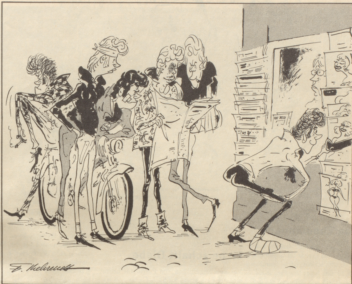
« Was schriibez i de Gazetli hüt über eus? »