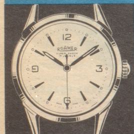
Roamer Watch Co. S.A. Solothurn