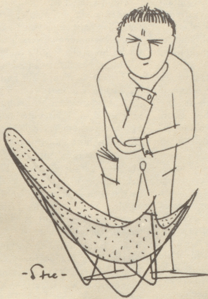
Wohnberater X. Bombaron schuf den Stuhl der neuen Richtung,