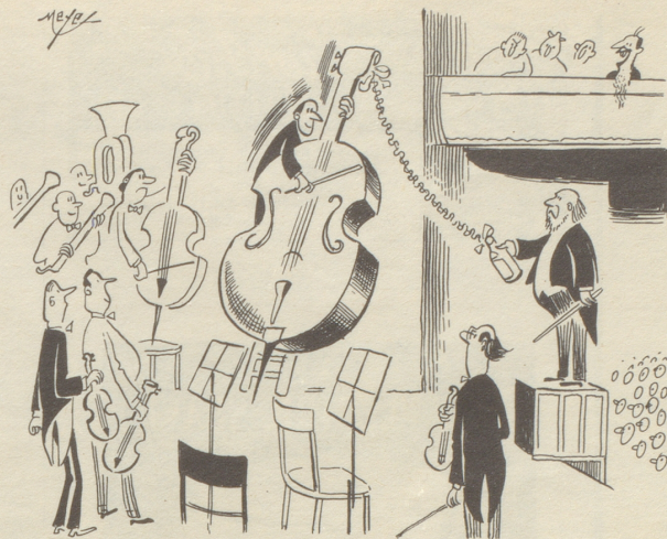
Ein Instrument wird getauft

An einem schönen, blaugoldenen Morgen schaute ich auf den schimmernden Lago Maggiore, auf die Berge ringsherum und zu den kleinen Tessiner Dörfern ennet des Sees und freute mich an der Schönheit dieses Heimatzipfelchens. Den Einkaufskorb am Arm, wandte ich mich wieder der Straße zu. Da, mitten auf der Fahrbahn, bewegte sich eine Schnecke unter der Last ihres Häuschens in ihrem gemächlichen Tempo. «Du armer Schnegg, hier wirst du vom nächsten Auto überfahren werden; komm ich trage dich zur Wiese hinüber!» - und mit der einen Hand wollte ich das