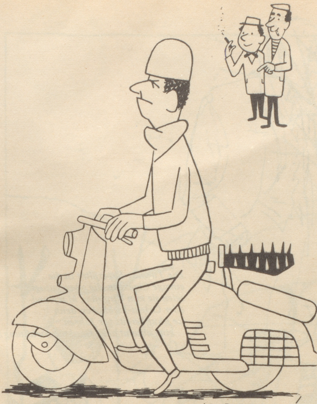
Der Mann der die Stoper satt hat.