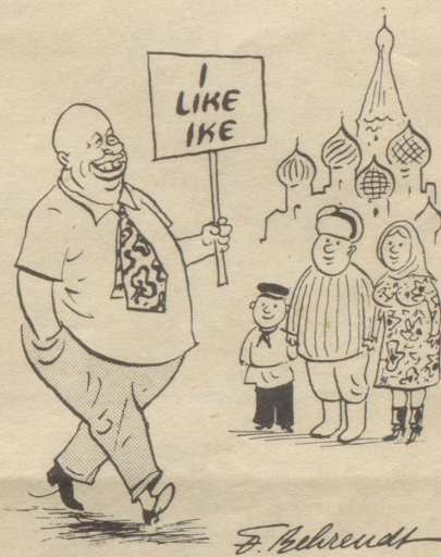
Vielleicht hilft es!

Leute, die zu lange auf einem Parkplatz stehengeblieben sind, mit einem Bleistift in ein Büchlein zu schreiben.