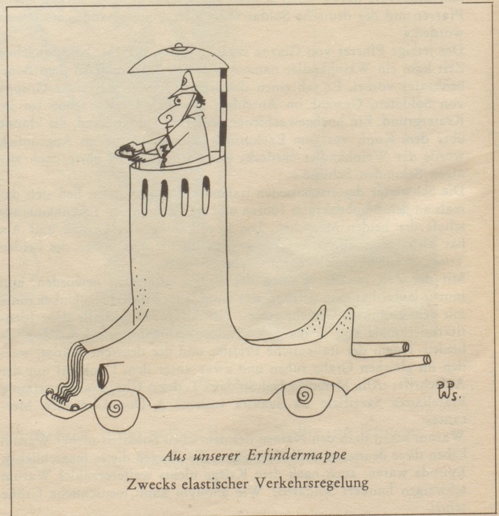
Aus unserer Erfindermappe Zwecks elastischer Verkehrsregelung

Ferien gönnt er sich kaum, denn als Oberstleutnant muß er in seinen Mußwochen die Probleme der Landesverteidigung lösen helfen. Man würde es kaum glauben, aber es stimmt: dieser energische, ums Gemeinwohl so besorgte weltoffene Mann findet abends noch Zeit, nach Konstanz zu fahren, um dort den Kontakt mit dem benachbarten deutschen Volk zu pflegen!»