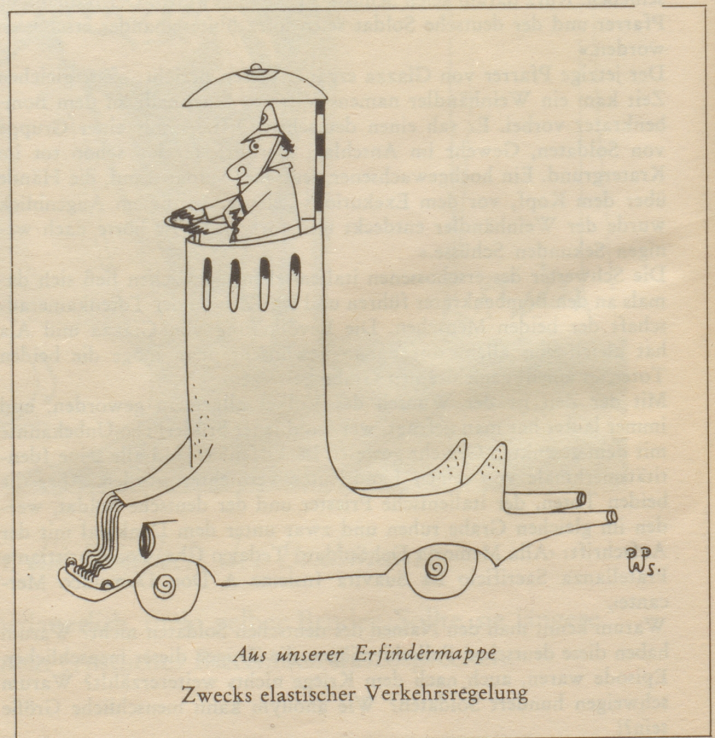
Aus unserer Erfindermappe Zwecks elastischer Verkehrsregelung

Ferien gönnt er sich kaum, denn als Oberstleutnant muß er in seinen Mußwochen die Probleme der Landesverteidigung lösen helfen. Man würde es kaum glauben, aber es stimmt: dieser energische, ums Gemeinwohl so besorgte weltoffene Mann findet abends noch Zeit, nach Konstanz zu fahren, um dort den Kontakt mit dem benachbarten deutschen Volk zu pflegen!»