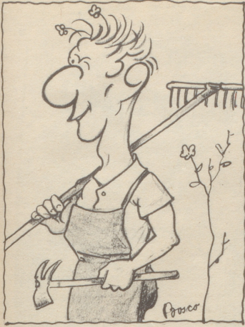
Der Beruf formt den Menschen Gärtner (G 59)