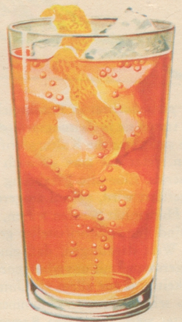
On the Rocks Ein mit Eiswürfeln bis an den Rand gefülltes Normal-Whiskyglas mit 40-50 gr. Four Roses Bourbon Whisky übergießen. Je nach Wunsch mit Sodawasser auffüllen u. dann eine Zitronenspirale dazugeben.