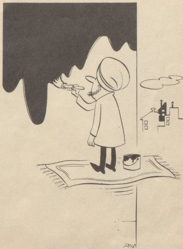
Malerei leicht gemacht