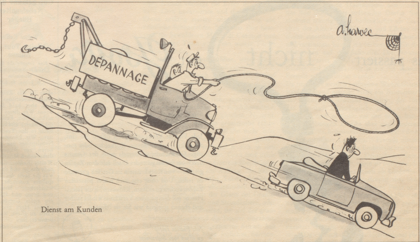
Dienst am Kunden

Blehbüchsen, die nicht nach Alpenflora duften. Immer nach mehr Beute lüsternd und gar vom Ehrgeiz getrieben, selbst eine neue Schmetterlingsart zu entdecken und ihr den eigenen bürgerlichen Namen geben zu können, drängt man zwischen harzduftenden Föhren, sperrigen Gräsern, Wermut und Berberitze in die unzivilisierte Welt vor. Auch walzenförmige Larven, Raupen mit Punkt- augen, Hörnern und Borsten wandern in die Blehbüchsen, als wären sie dafür geboren wie die Oelsardinen.