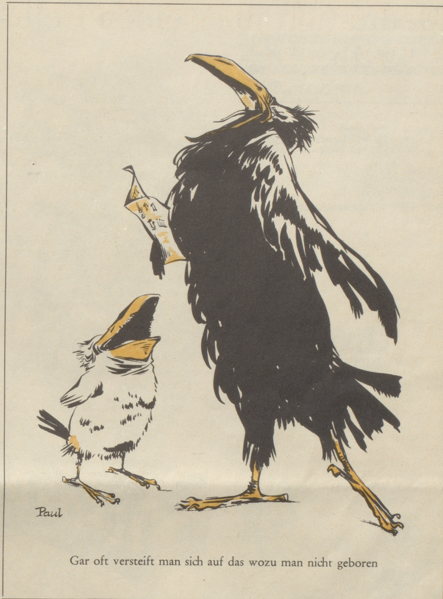
Gar oft versteift man sich auf das wozu man nicht geboren