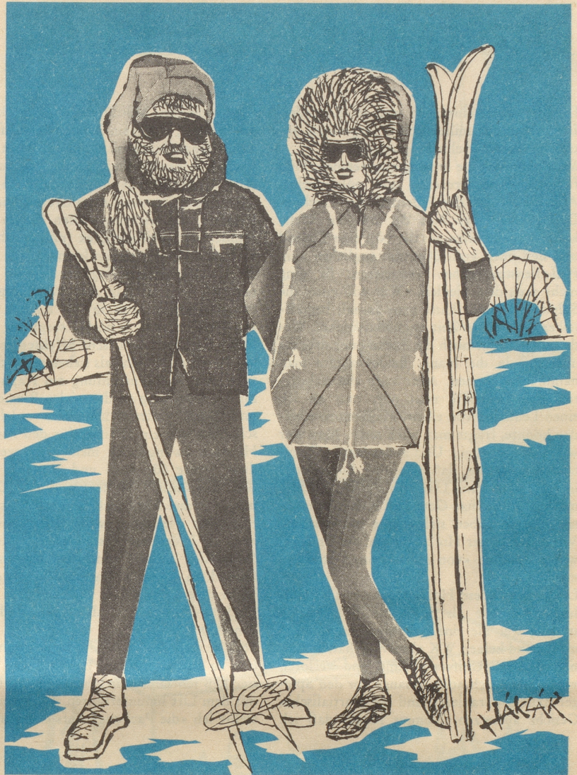
Der modische Akzent liegt heuer oben!