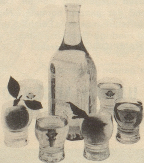
Schweiz. Obsterband Zug