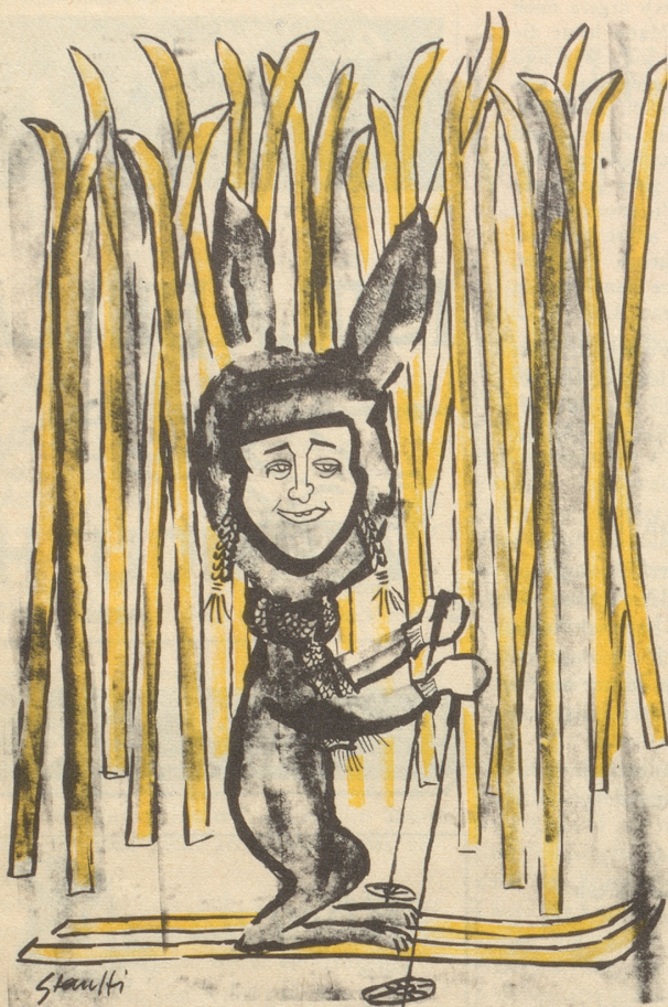
Skihäschen im Winterwald: Annemarie Waser