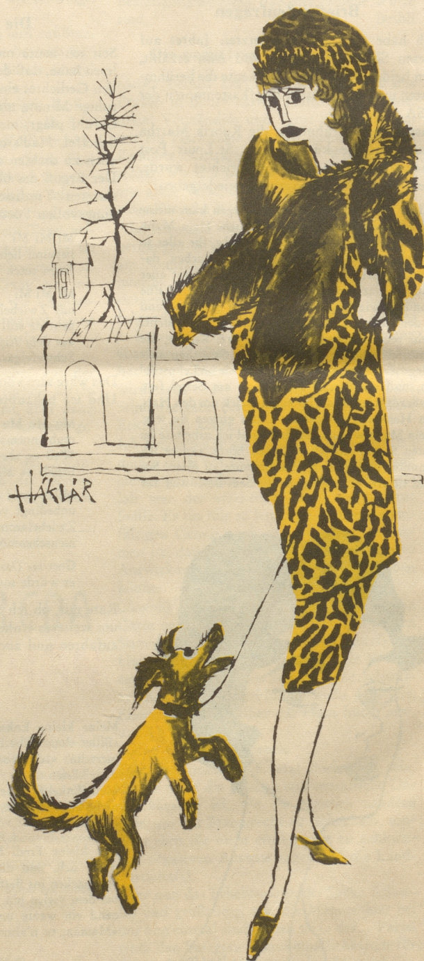
Die Tierfreundin Sie empfindet die organisierten Wildtierjagden als Kulturschande!