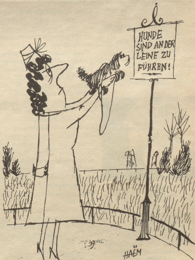
«Geesch Fifi i cha nüüt defür!»