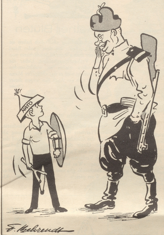
10 Jahre NATO