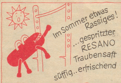
Bezugsquellennachweis durch: Brauerei Uster

Beide arbeiten vorzugsweise mit Gold und Silber. TM