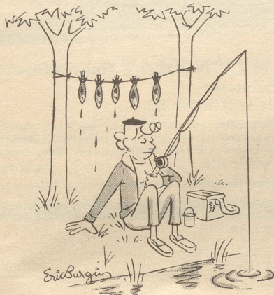
Ordnung muß sein!

Antwort: «Entweder hast Du nicht die richtigen Mädchen, oder nicht den richtigen Freund. Oder beides.»