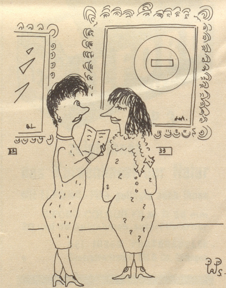
« ... die Moderne werde immer wie meh volkstümlich. »