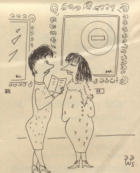
«... die Moderne werde immer wie meh volkstümlich.»