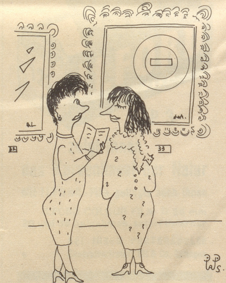
« ... die Moderne werde immer wie meh volkstümlich. »