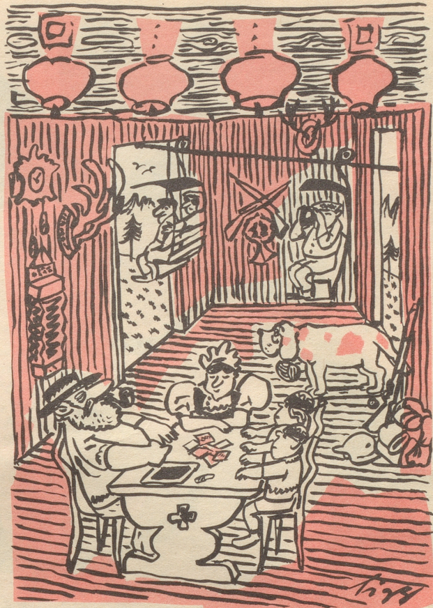
Die Reiseorganisationen bringen die Völker einander näher.

Rationelle Kollektivbesichtigung einer Schweizer Bauernstube mit Familie am Tisch