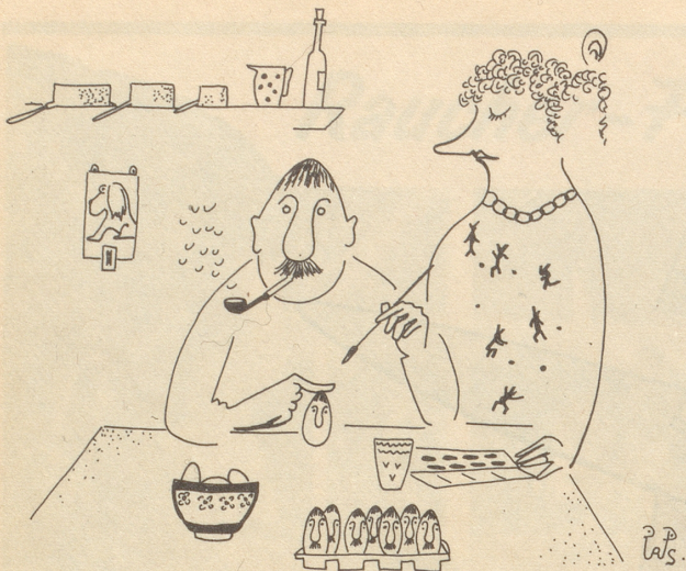
« si müend ja nid dir gfale, si sind ja für Kind. »