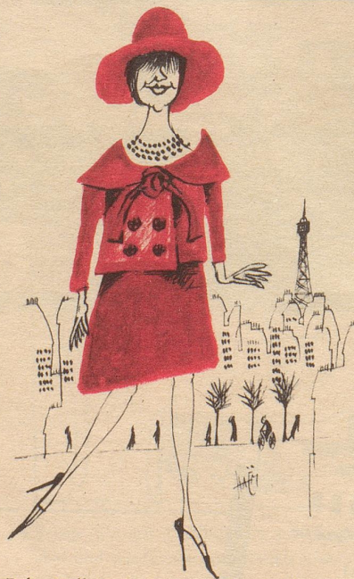
Baby-Doll-Mode für junge Damen über vierzig