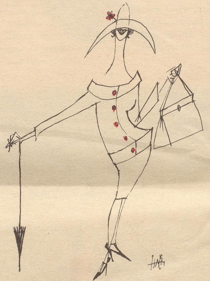
Modische Haltung für 1958