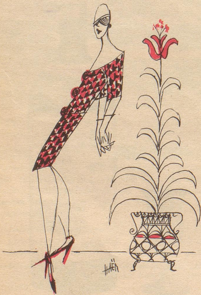
Modische Haltung für 1958