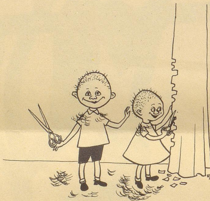
Mer händ nu Coifförlis gschpillt!