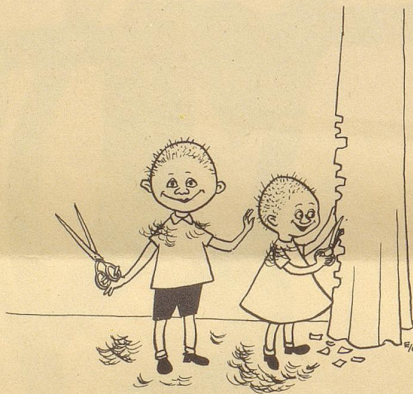
Mer händ nu Coifförlis gschpillt!