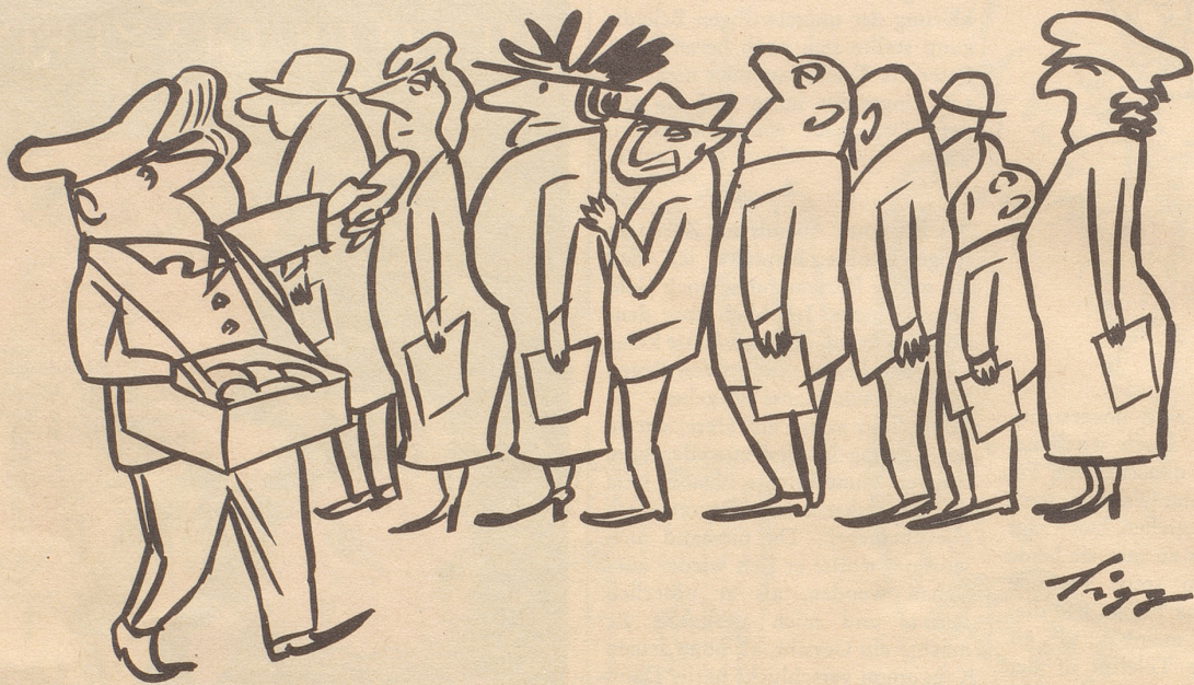
1. April auf dem Strassenverkehrsamt. «Sändwitsch!»