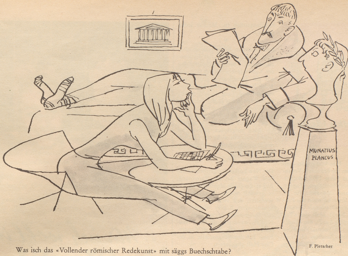
Was isch das «Vollender römischer Redekunst» mit säggs Buechschtabe? Dängg «Waggis»!