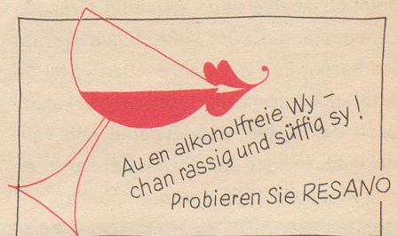
Bezugsquellennachweis durch: Brauerei Uster

nooblar sii und sääga: Feerigescht, wo göönd go fische und nia aswas fangand, söttandi nüüt müassa zaala. Söttigi, wo bejm Fische no dNatuur aaluagand und tüüf schnuufand, hend zwai Schtutz pro Taag zblähha. Und wenss zuafellig no sötti Fische ggee, won aswas ussazüühand – nu, mit denna khönnti dar Fischarej-Uufsähhar am Schluß vu da Feerian aprächna!