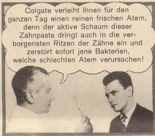
SPÄTER — dank Colgate: