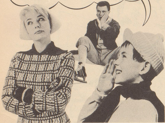
Was Peter erfuhr!