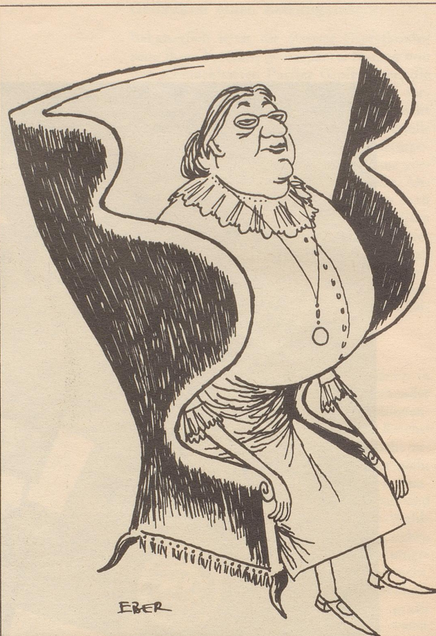
Das individuelle Möbel

Senkrecht: 1 Kopfwehgeplagte schlucken es und Weidmänner lassen es in Rauch aufgehen; 2 .. Berge sich erheben; 3 wird in Opern gesungen; 4 steht den Gästen von Adelboden von Mitte Dezember bis Ende März zur Verfügung; 5 Bergsteiger besteigen sie in den Karpaten; 6 so notiert der Wetterwart die Himmelsrichtung Ostnordosten; 7 wie 15 waagrecht; 8 Osten (französisch); 9 wer eine Fahrt macht, zieht sie über die Knie; 10 wurde