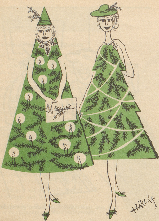
Warum nicht auch das noch?!