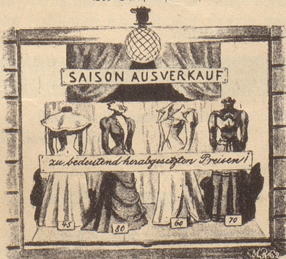
wie Goldbirn die Preise bedeutend herabsetzte.

Aus den «Fliegenden Blättern» Jahrgang 1898