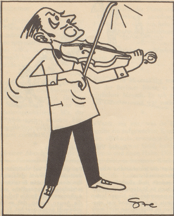
Es ist des Zeichners Schuld!