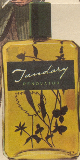
JANDARY Renovator grün ist die bevorzugte Sorte. Mit oder ohne Fett. Ihr Coiffeur macht Ihnen gerne eine Fraktion mit dieser hervorragenden, rein pflanzlichen Lotion. Fr. 3.65, Fr. 6.25