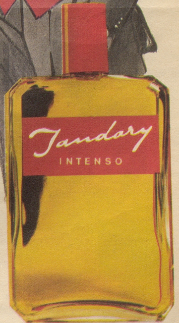
JANDARY Intenso (Spezial-Formel) ist das erste selbstmassierende Haartonikum, das auf der Grundlage einer Durchblutungssteigerung der Kopfhaut den Haarboden stärkt und damit einen milden Haarwachstumsreiz auslöst. Fr. 6.25