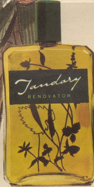
JANDARY Renovator grün ist die bevorzugte Sorte. Mit oder ohne Fett. Ihr Coiffeur macht Ihnen gerne eine Fraktion mit dieser hervorragenden, rein pflanzlichen Lotion. Fr. 3.65, Fr. 6.25