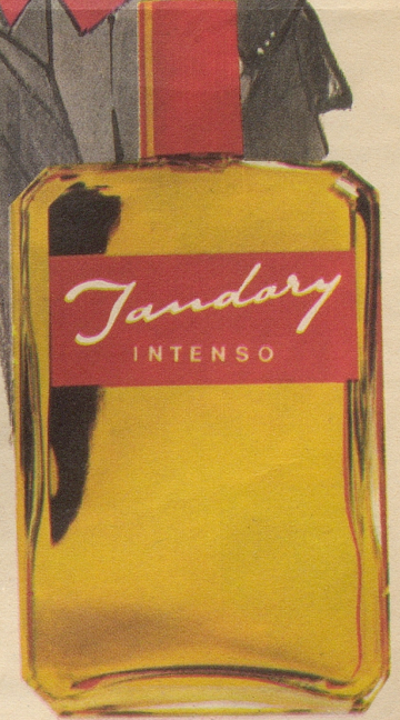
JANDARY Intenso (Spezial-Formel) ist das erste selbstmassierende Haartonikum, das auf der Grundlage einer Durchblutungssteigerung der Kopfhaut den Haarboden stärkt und damit einen milden Haarwachstumsreiz auslöst. Fr. 6.25