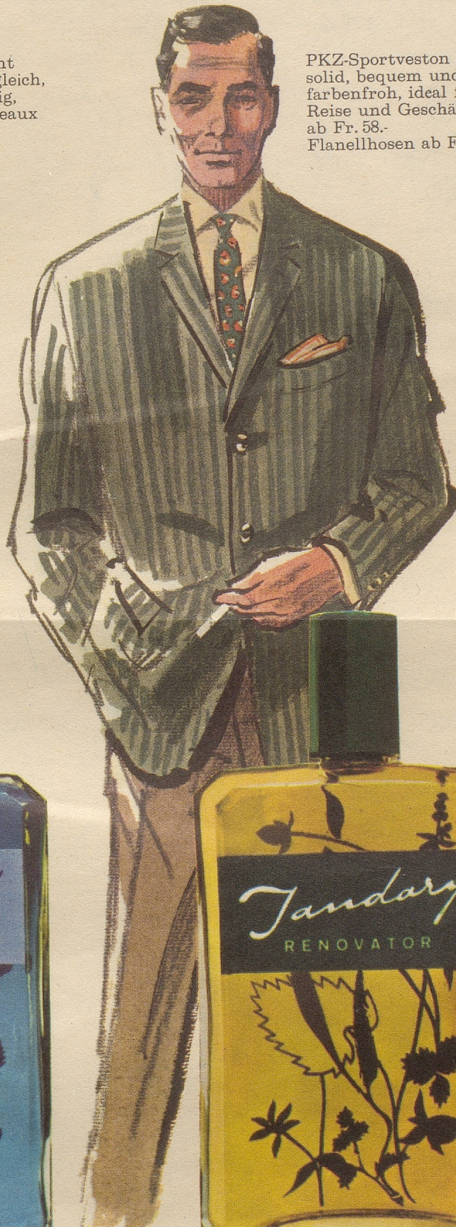
PKZ-Sportveston solid, bequem und farbenfroh, ideal für Reise und Geschäft, ab Fr. 58.- Flanellhosen ab Fr. 44.-