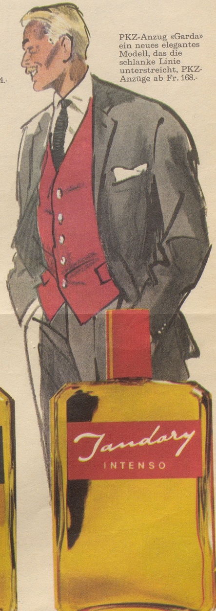
PKZ-Anzug «Garda» ein neues elegantes Modell, das die schlanke Linie unterstreicht, PKZ-Anzüge ab Fr. 168.-