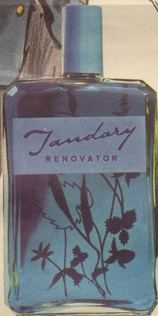
NEU: JANDARY blau Für jedes Haar, speziell aber für graues und weisses Haar. Auch diese Sorte enthält die natürlichen Pflanzenextrakte, welche seit Jahren den Erfolg von Jandary begründen. Fr. 3.65, Fr. 6.25