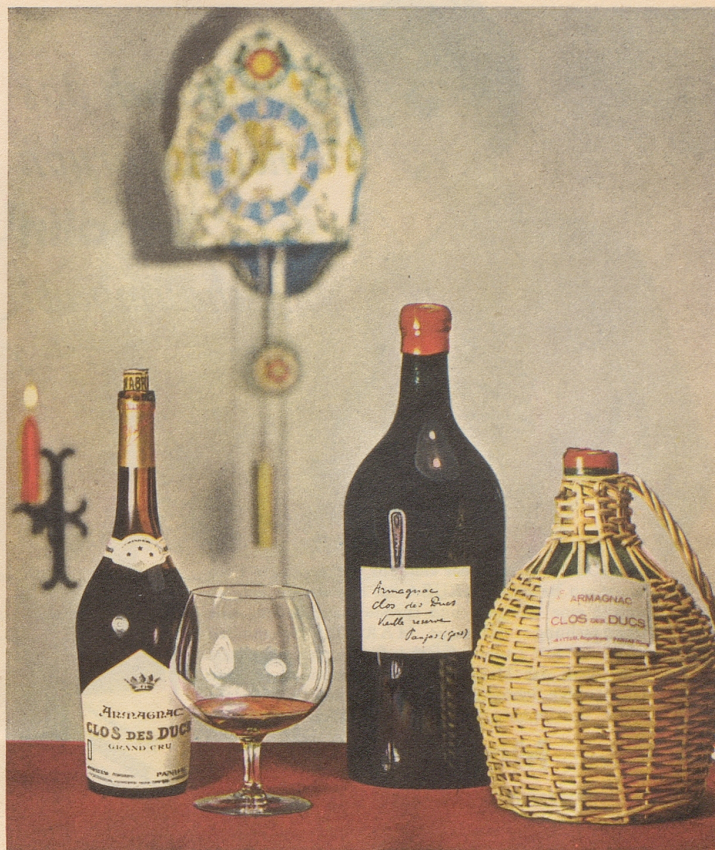
Armagnac CLOS DES DUCS

bat Stil und Temperament darum ist er auch der erklärte Favorit soignierter Kenner!