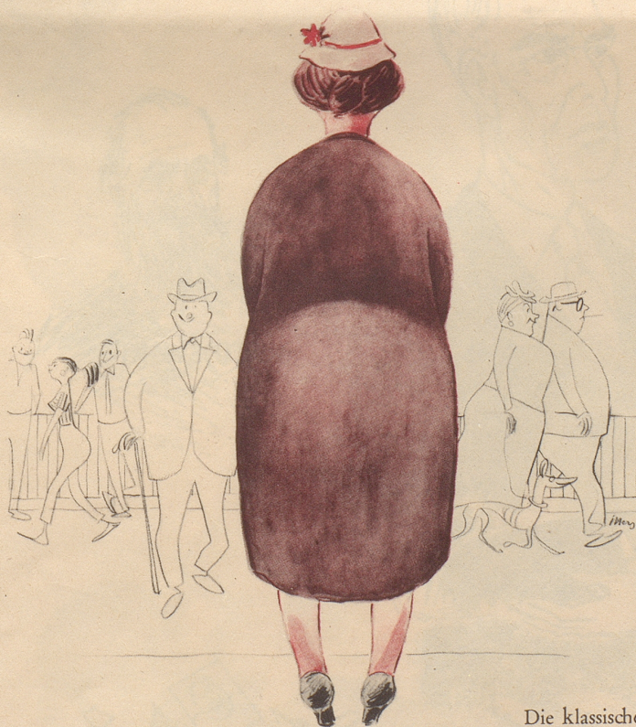
Die klassische Linie

Der Schriftsteller Boris Pasternak hat aus freiem Willen auf den Nobelpreis verzichtet. Aus Chruschtschews freiem Willen.