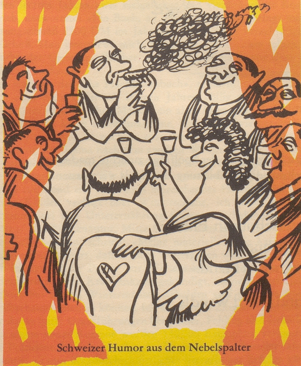
Schweizer Humor aus dem Nebelspalter