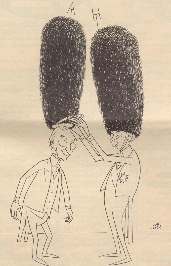
Heuss bringt Adenauer Souvenir

Ein Zehnjähriger brachte in eine Filiale der N.Y. Public Library sein überfälliges Buch zurück. Als ihm die Bibliothekarin zwei Cents Strafgebühr abverlangte, fragte er sie treuherzig: «Können Sie wirklich davon leben?»