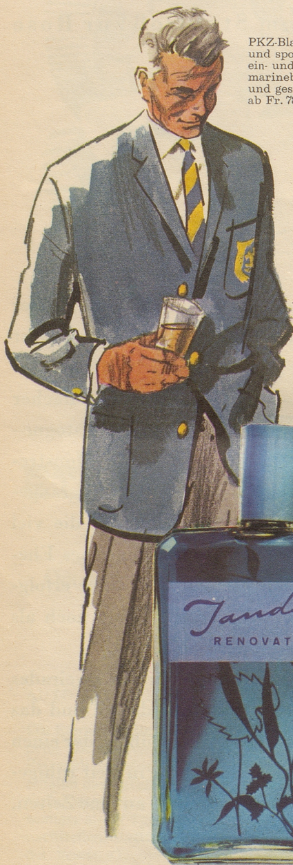
PKZ-Blazer elegant und sportlich zugleich, ein- und zweireihig, marineblau, bordeaux und gestreift. ab Fr. 78.-