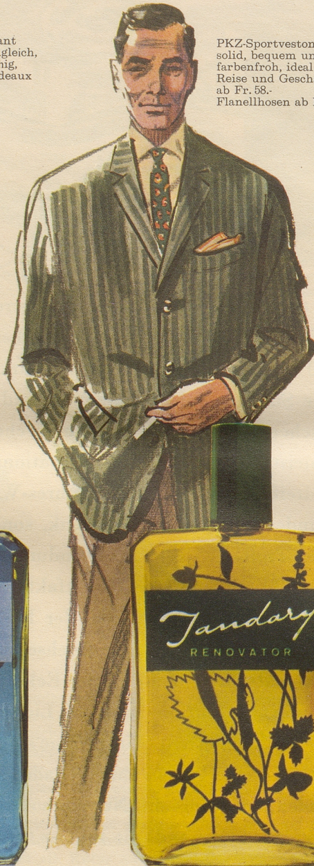
PKZ-Sportveston solid, bequem und farbenfroh, ideal für Reise und Geschäft, ab Fr. 58.- Flanellhosen ab Fr. 44.-