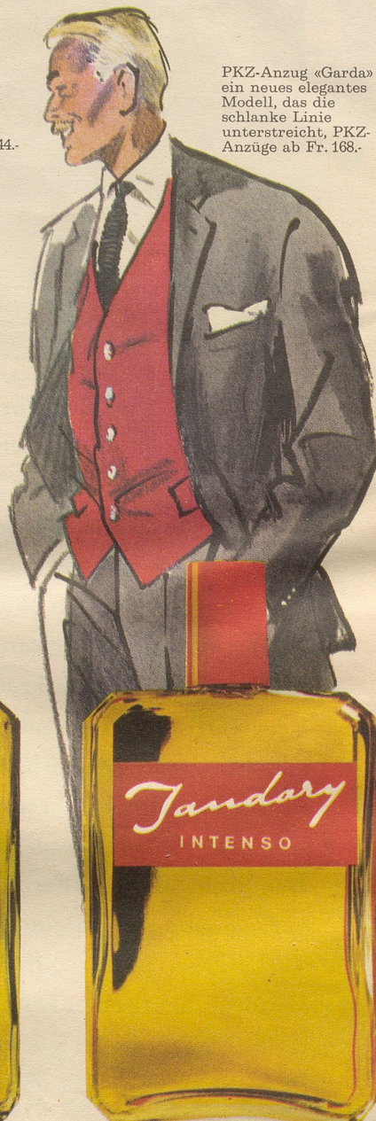
PKZ-Anzug «Garda» ein neues elegantes Modell, das die schlanke Linie unterstreicht, PKZ-Anzüge ab Fr. 168.-

NEU: JANDARY blau Für jedes Haar, speziell aber für graues und weisses Haar. Auch diese Sorte enthält die natürlichen Pflanzenextrakte, welche seit Jahren den Erfolg von Jandary begründen. Fr. 3.65, Fr. 6.25