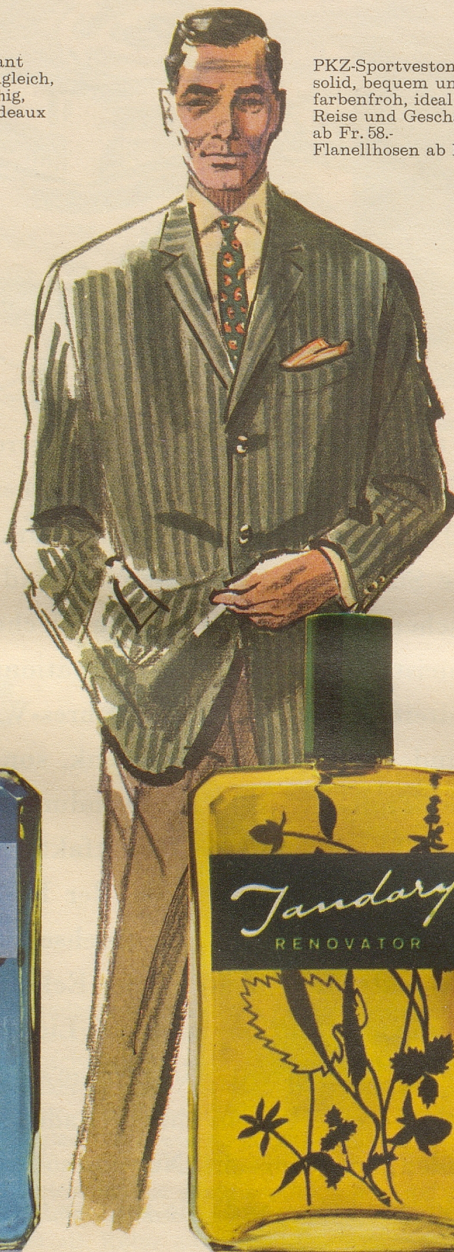
PKZ-Sportveston solid, bequem und farbenfroh, ideal für Reise und Geschäft, ab Fr. 58.- Flanellhosen ab Fr. 44.-