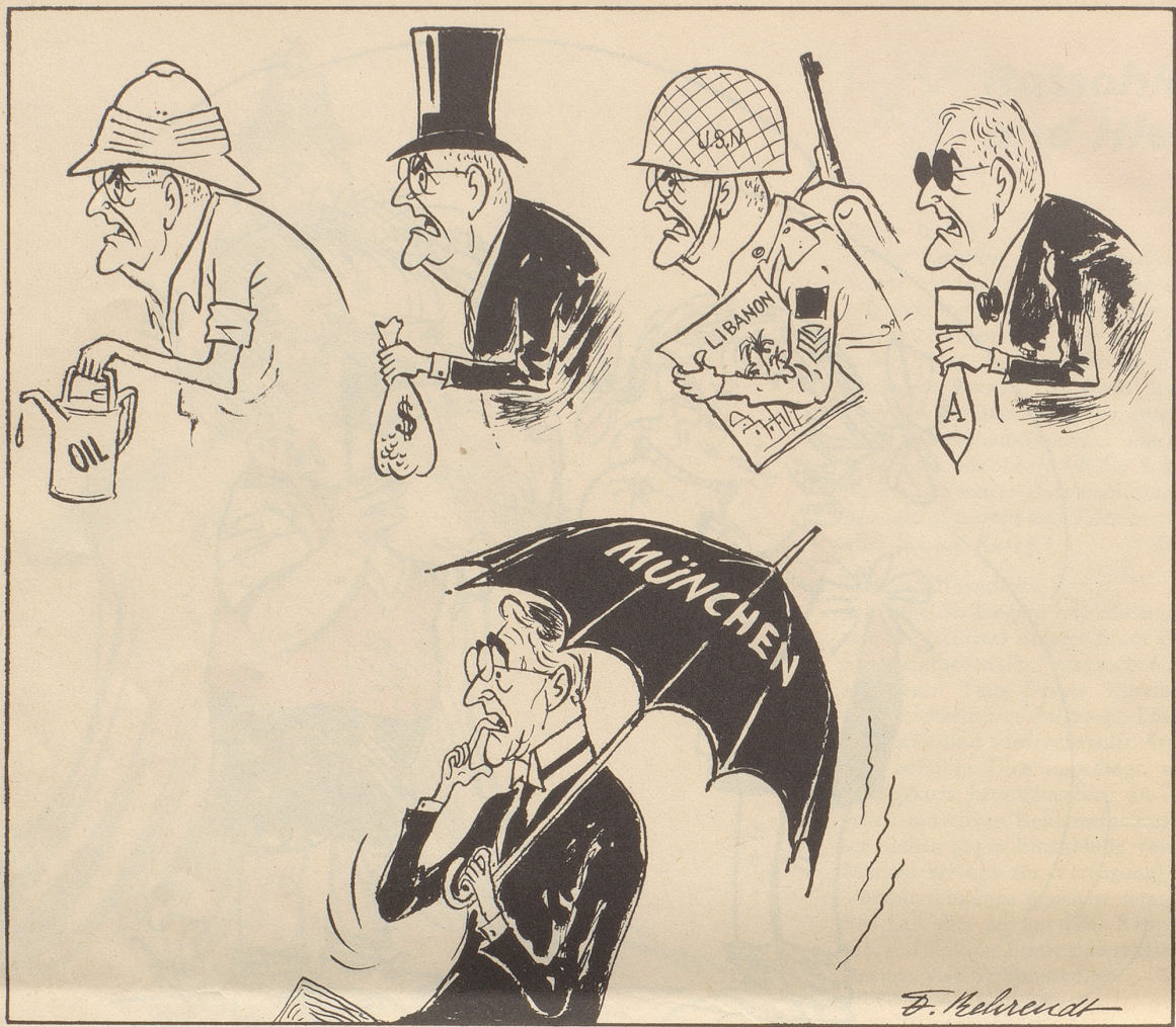
20 Jahre nach «München»

Man kann Dulles manches vorwerfen — aber nicht, daß er Chamberlain ähnelt!