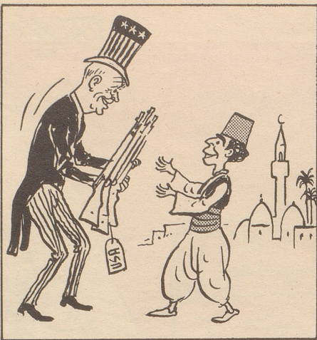
... ist eine Kunst ...